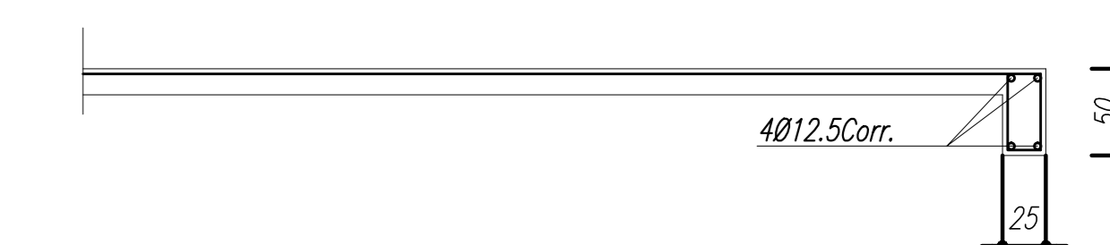
DETALHE DA VIGA DE BORDO (VB)